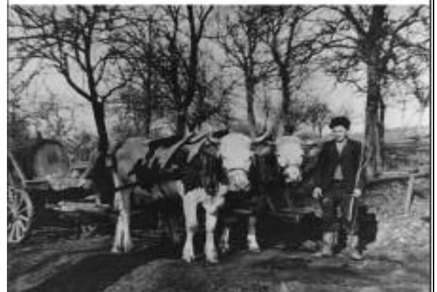
Meine Kindheit und Jugend in Marschalling