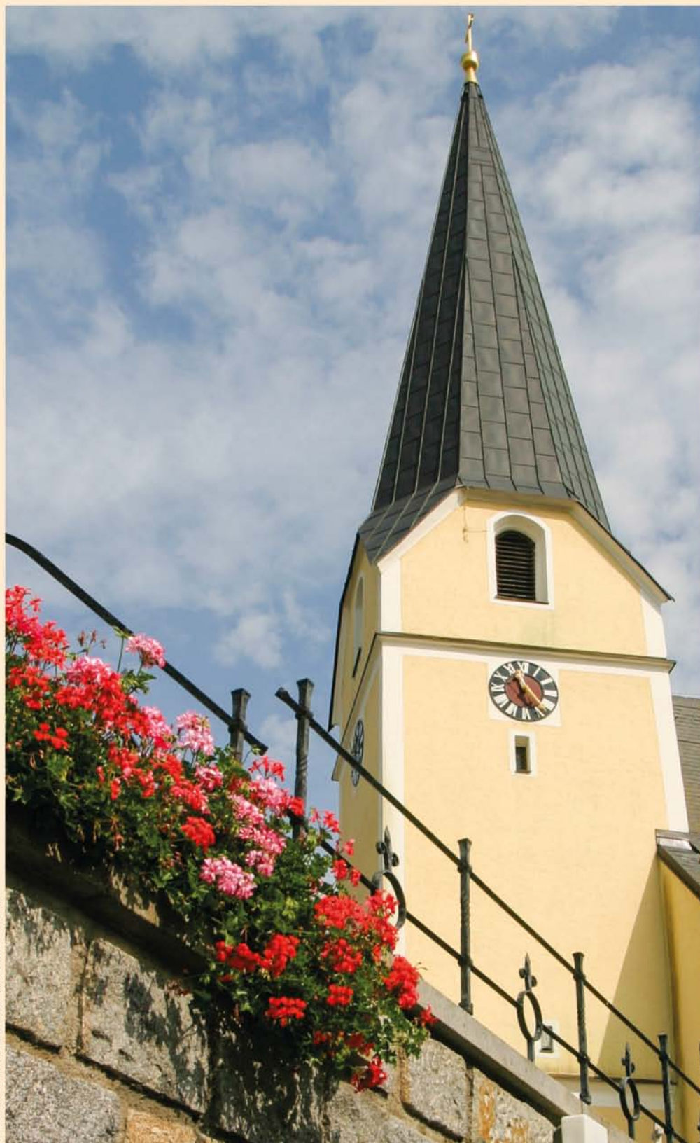
Geboltskirchen Kirchturm 2005