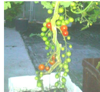
Cocktailtomate „Olivia“ ertragreich und super süß