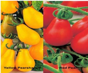
Gelbe und rote Cocktail Birnentomaten