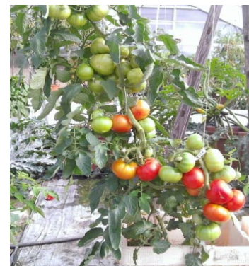
Fleischtomate „Super Marmande“

Es erwarten Sie Pflanzen in Hülle und Fülle in hervorragender Qualität und tolle Aktionen.