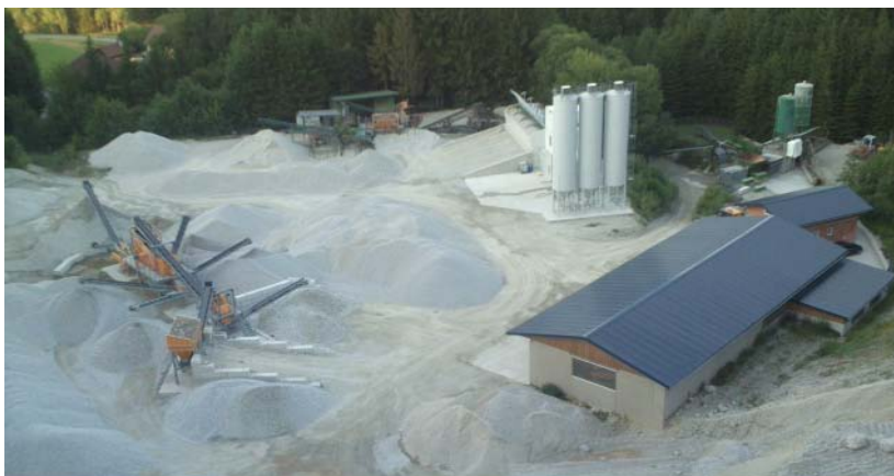
Blick von der Abbauwand auf das Betriebsgelände Stand Juni 2014