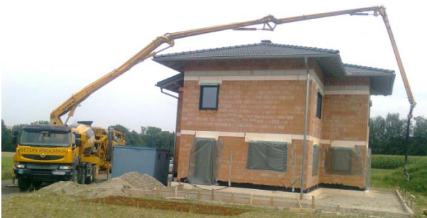
Betonpumpe beim Einbringen von Beton für eine Terrasse

Mit unseren leistungsstarken Fuhrpark wird Kies und Beton schnell zur Baustelle geliefert oder Erdaushub sauber weggefahren.