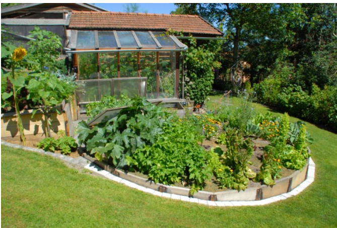
Der siegreiche Garten!