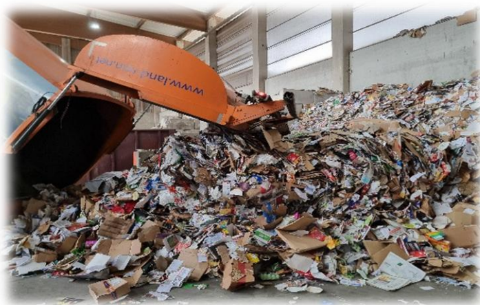
Entleerung der Altpapiertonnen: Sortenreine Altstoffe sind wertvoll.