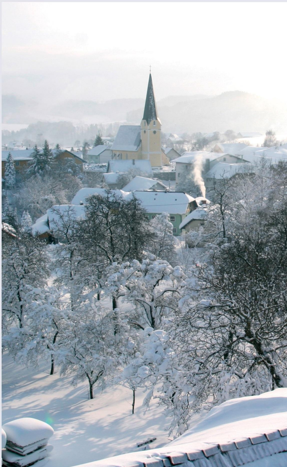
Geboltskirchen: Blick von Hofbauer Silo 2006